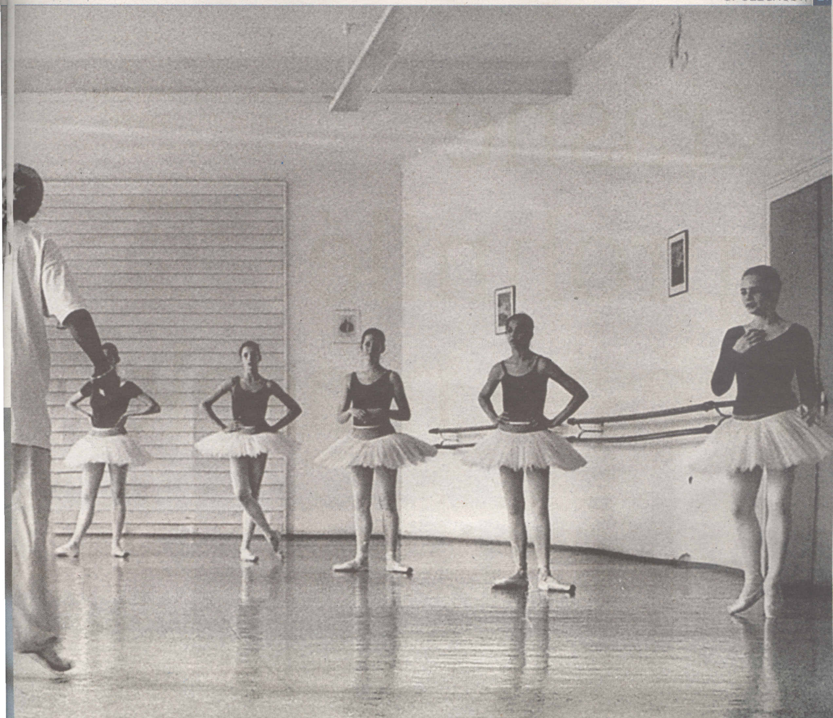
FOTO: JAN KÁBRT; FOTOGRAFOVÁNO NA TANEČNÍ KONZERVATOŘI HL. M. PRAHY S LASKAVÝM SVOLENÍM JEJÍHO VEDENÍ

Ted' si může i zalyžovat, což mívají baletky zakázané ve smlouvě.